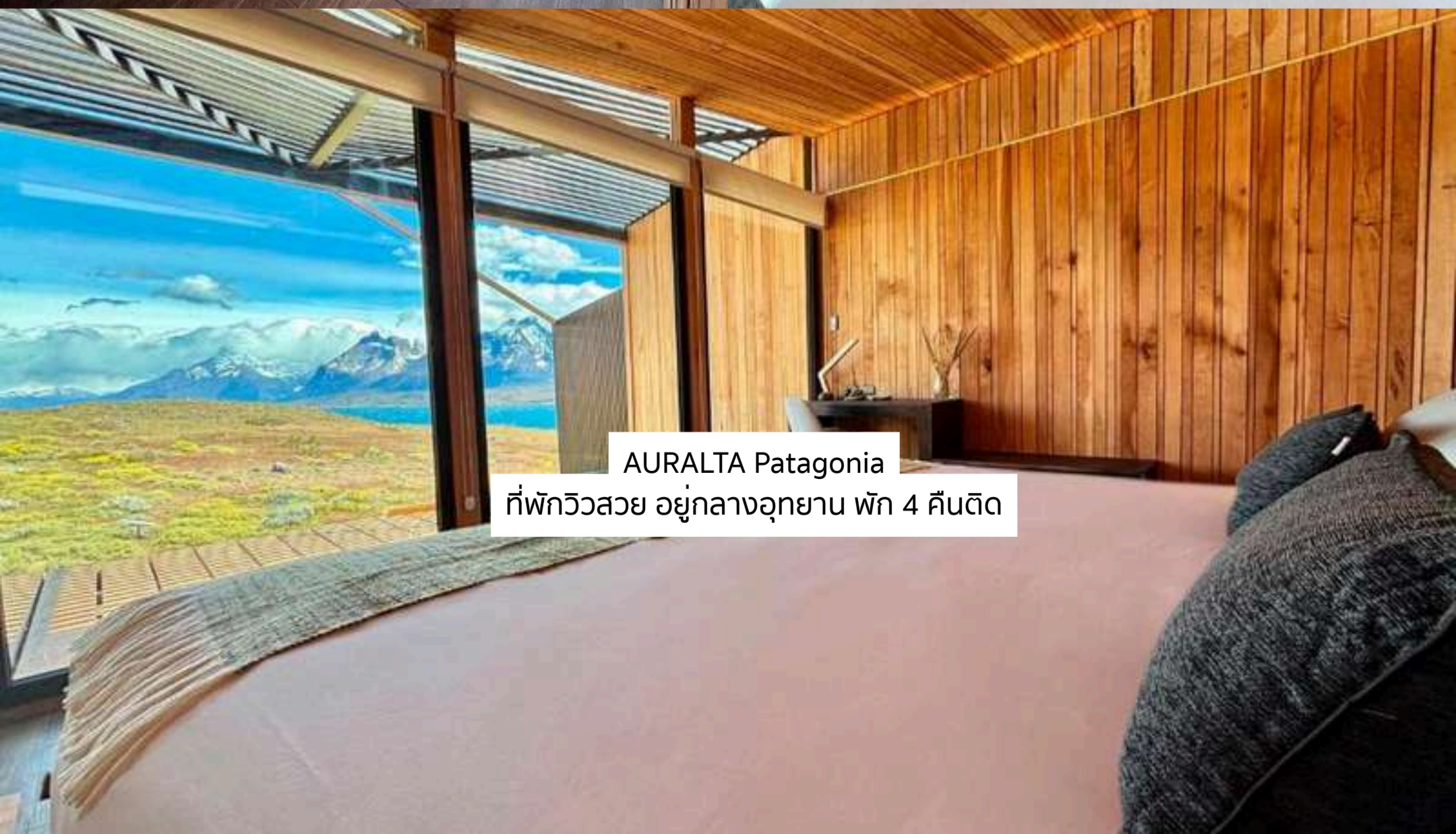
AURALTA Patagonia ที่พักวิวสวย อยู่กลางอุทยาน พัก 4 คืนติด