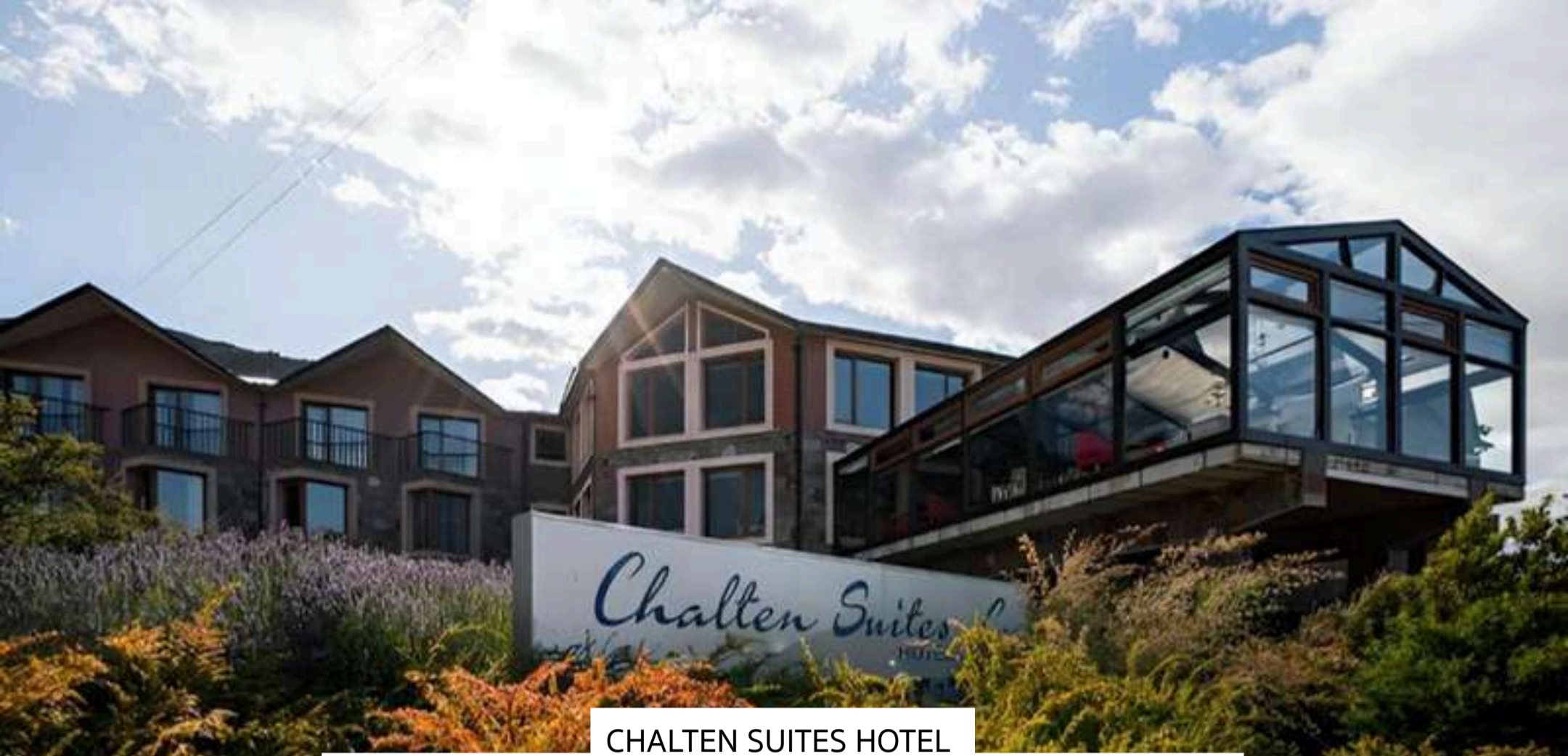
CHALTEN SUITES HOTEL

ที่พักกลางเมือง เป็นโรงแรมเต็มรูปแบบ ไม่ใช่อพาร์ทเมนต์ พักสามคืนติด